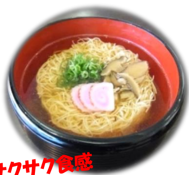
揚げめん サクサク食感 にゆうめん