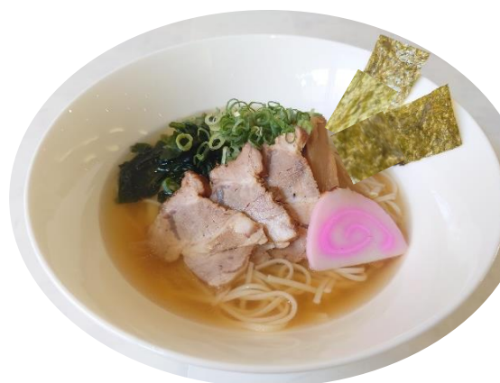
数量限定 醤油手延ラーメン 1300 円