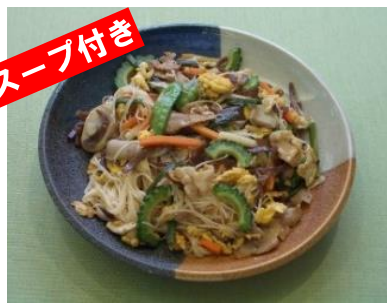
そうめんチャンプル