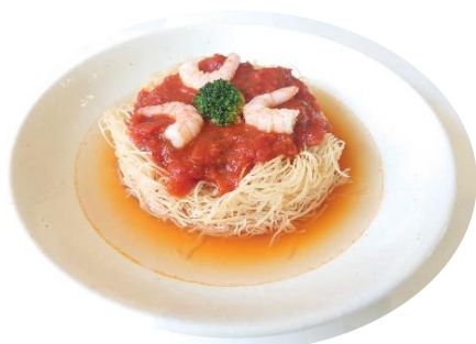
揚げ麵のトマトソース 950 円