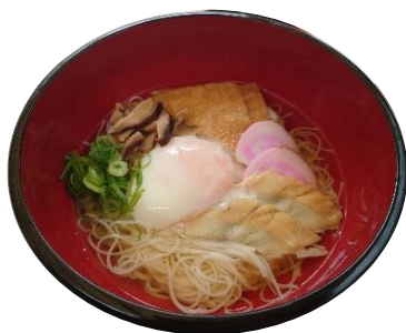
ハイカラにゆうめん