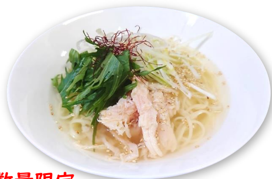
数量限定 鶏塩手延ラーメン 1100 円

兵庫県産の小麦を主体原料とし揖保乃系の手延製法により ツルツルしたのと越しや弾力のあるコシを実現した麺が誕生！ そうめんの里でしか味わえないこの麺をぜひ一度お召し上がりください