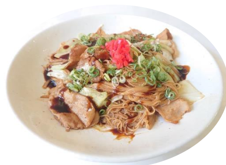
ソース焼きそうめん 930 円

あのメニューをもう一度食べたい！ あの味が忘れられない！ たくさんのご意見をいただき復活しました 是非この機会にお召し上がりください