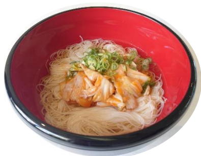
豚キムチにゆうめん 880 円

あのメニューをもう一度食べたい！ あの味が忘れられない！ たくさんのご意見をいただき復活しました 是非この機会にお召し上がりください