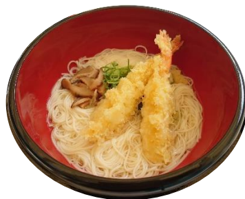
海老天にゆうめん